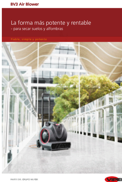
La imagen mostrada puede que no represente el modelo presupuestado