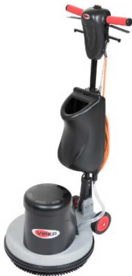
La imagen mostrada puede que no represente el modelo presupuestado

La rotativa Viper DS350 es robusta, fiable y fácil de usar, con diseño ergonómico, puede fregar, limpiar, abrillantar y pulir suelos. La máquina incluye el depósito de agua, cepillo y sujeta cepillo. Tiene como opcionales el generador de espuma y cepillo para alfombras.